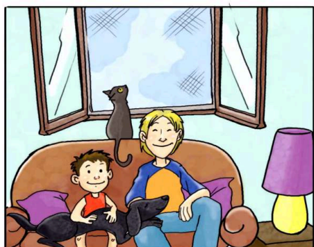
IN CASA USA LE ZANZARIERE ANZICHÉ ZAMPIRONI E FORNELLETTI.